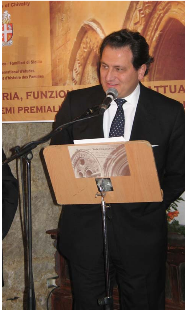
S.A.I.&R. l'Arciduca Josef d'Asburgo, Principe d'Ungheria